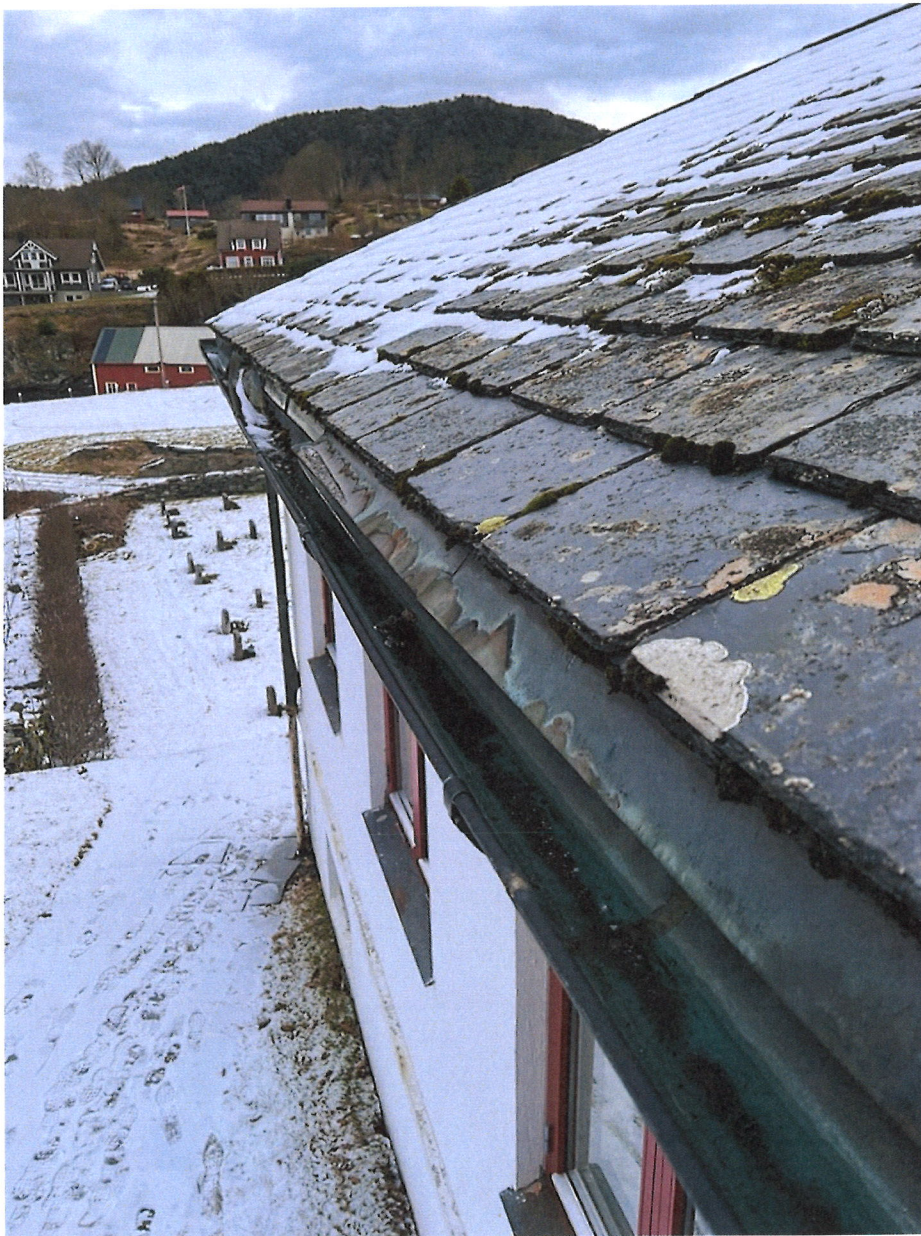
Dette fotografiet viser vestsida av kyrkjelydssalen.