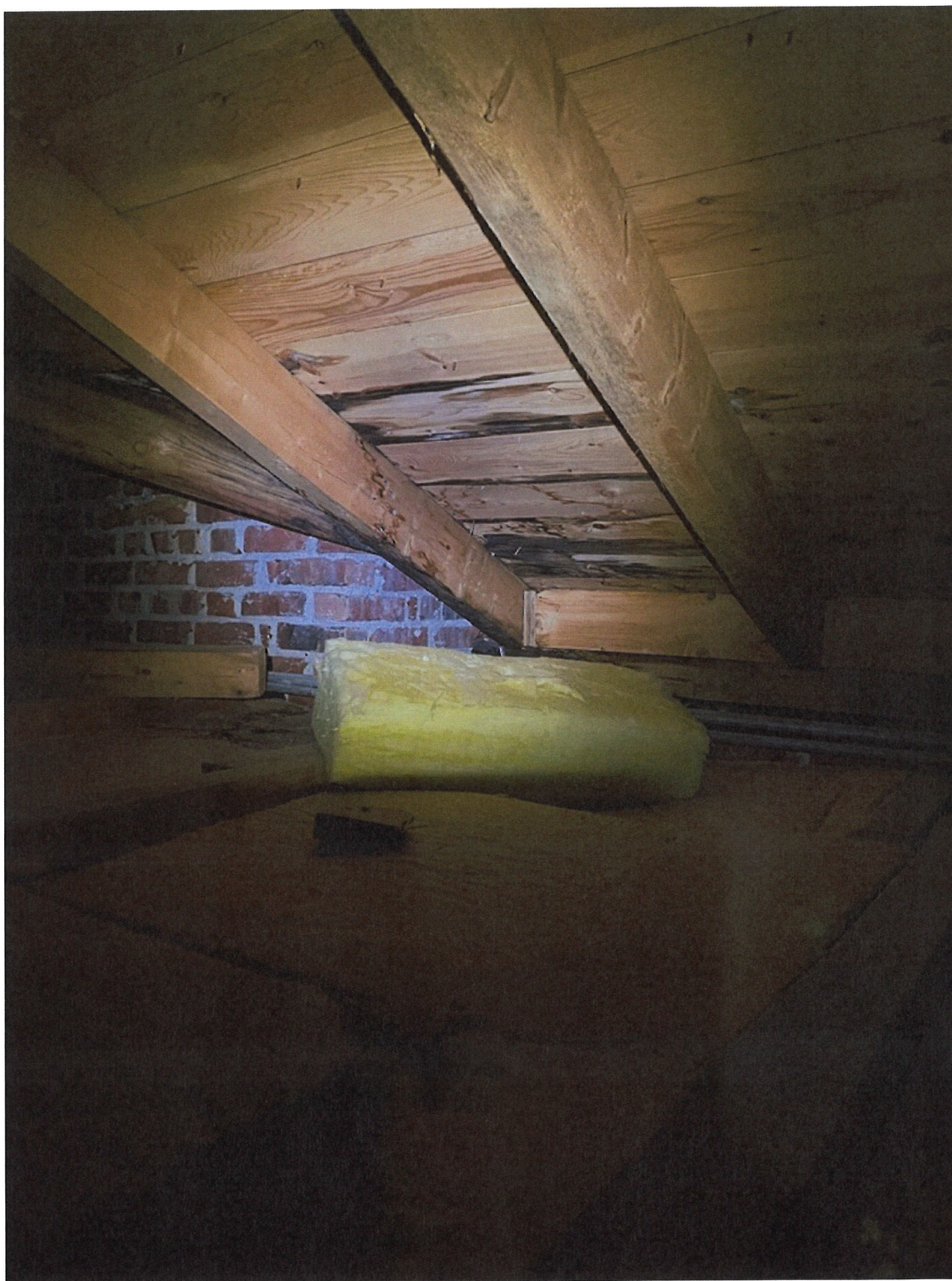
Treverket under sløysen på sudvestleg side av kyrkjelydssalen viser tydeleg skade av fukt.